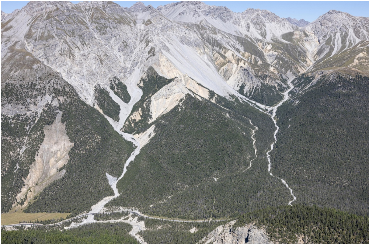
06.09.2023 | Schweizerischer Nationalpark

Steige nun die Treppe hinunter und betrachte gleich das erste Bild links: