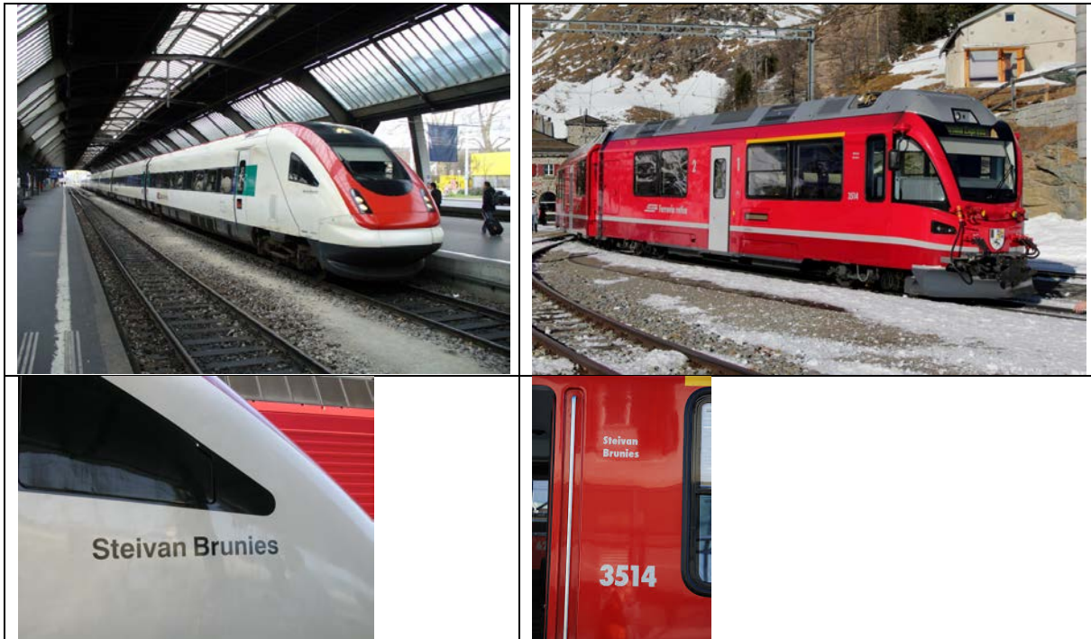
Bilder aus dem Internet

Auf dem Schweizer Schienennetz verkehren zwei Züge, die auf den Namen «Steivan Brunies» getauft wurden, einer auf der SBB und einer bei den RhB.