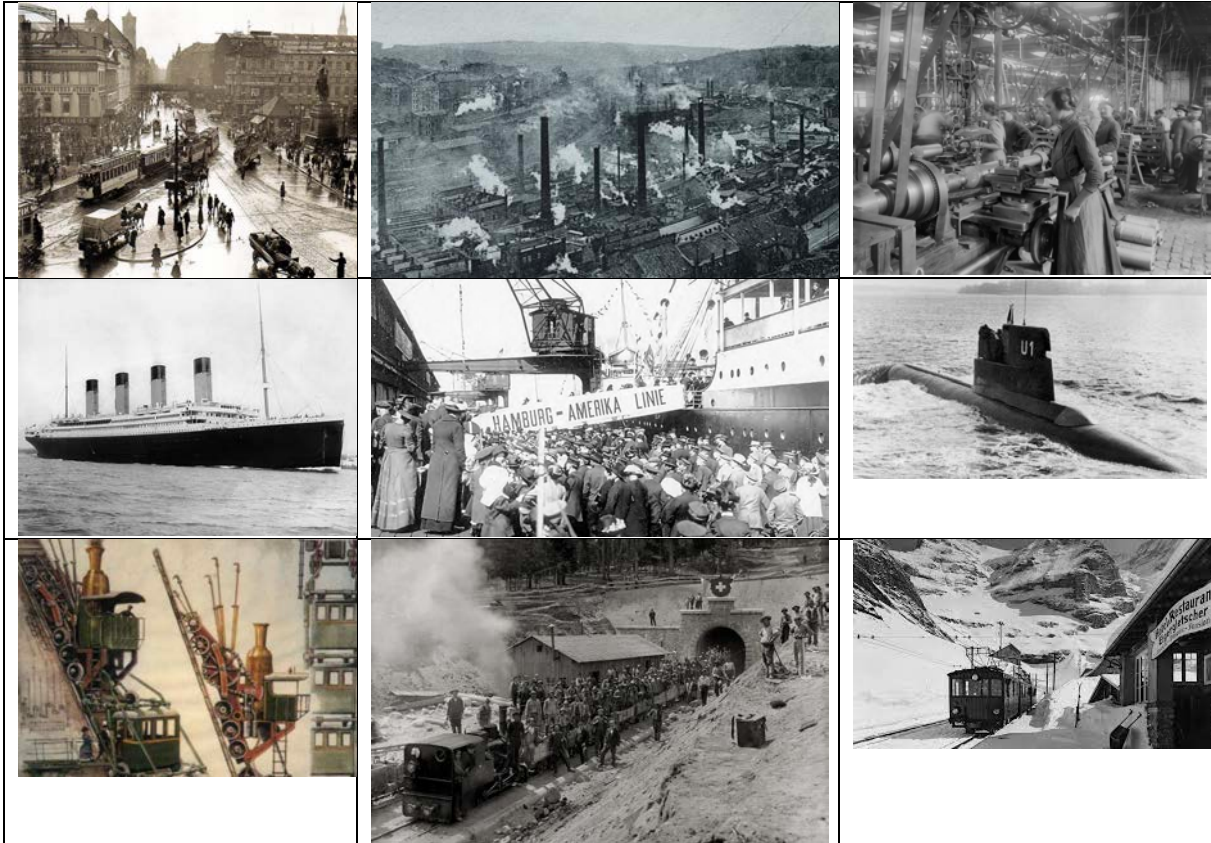
Bilder aus dem Internet

Ein Typisches Bild aus der Zeit vor der Jahrhundertwende im Engadin ist das Bild vom Dorfbrand von Zernez von 1872, das du vor dem Treppenaufgang rechts findest.